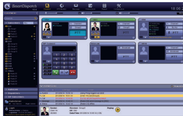
音声通信管理画面